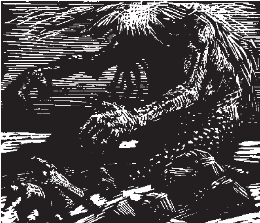
En af fars trolske trolde.

10.000 efterladte arbejder på Vejle Kunstmuseum vidner om hans fænomenale kreative kraft. Den lod ham aldrig i fred, og han ønskede det heller ikke. Det var hans liv. I et lille digt fra 70'erne, som hedder "Drøm", skriver han: