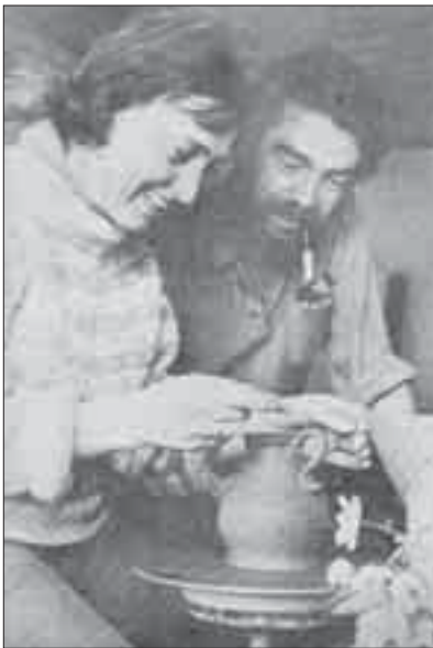
Mor og far, 1970. Mor havde keramikværksted på Klintholmvej i Faldsled og drev butikken Kit keramik i Det Gamle Pakhus på havnen i Fåborg.

indhold. Helst på en måde, der fuld af anelser og hemmeligheder åbnede for læserens egen indlevelse som en art tredje øje. Far havde en frodig evne til at fabulere over et tema og kombinere det med noget, man kunne kalde væsensførmelse. Både nærværet og magien udsprang af den evne, ellers skulle der såmænd ikke meget andet end en gammel fyldepen eller et stykke kul til. Jo for resten, en pipe tobak.