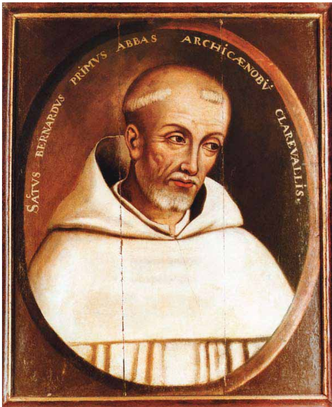
SANKT BERNHARD AF CLAIRVAUX