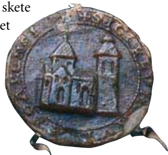
MIDDELALDERLIGT SEGL FRA SKARA

Og så blev Gud så sandelig synlig. Hvad enten det nu skete for at frelse menneskeheden eller af helt andre årsager. Det var et skue, som ingen mennesker nogensinde før havde