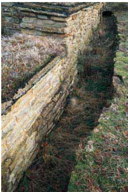
VANDINGSKANAL, VARNHEM KLOSTER

Henri havde tålmodigt forklaret, hvad man gjorde, og hvad meningen var med det. Hun havde haft sine to bedste trælle med. Svarte, som var den, der skulle gøre Sot med barn, og Gur, som havde kone og unger oppe i Arnäs. Af hensyn til dem havde hun oversat præstens latin, så de kunne forstå, hvad Fader Henri forklarede.