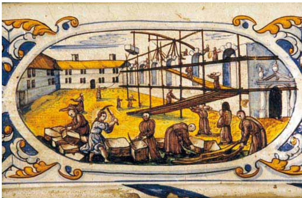
KLOSTER UNDER OPBYGNING

Efter en tid tilbød Sigrid så lægbrødrene, at de kunne få hjælp af Svarte og Gur, og ideen med det var egentlig, at de to trælle skulle stå i lære hos håndværkerne. Fader Henri tog imod tilbudet og fastholdt det, også selvom nogle af lægbrødrene kom til ham og beklagede sig over, at trællene mest tumlede forvirret rundt. Han forstod nemlig udmærket, hvad Sigrid ønskede at opnå. Han havde oven i købet forklaret det for Broder Guilbert, så derfor blev trællene – til mange lægbrøders irritation – hele tiden sendt videre til en ny arbejdsplads, netop som de var ved at komme efter det på den gamle. Hvorefter fumleriet og dumhederne fortsatte. De skulle hugge sten, slibe sten, forme glødende jern, sætte vandhjul sammen af egetræsstykker, stensætte en brønd eller en kanal, rense skovområder for alt det, som ikke skulle vokse der. De skulle hugge egetræ og bøgetræ og skulle lære at forme stammerne til forskellige formål. Og det gjorde de så. Faktisk varede det ikke ret længe, før de to kloge trælle havde lært det meste. Sigrid forhørte sig hele tiden om deres fremskridt og lagde planer for, hvordan deres nye viden kunne bruges i fremtiden. Hun havde faktisk