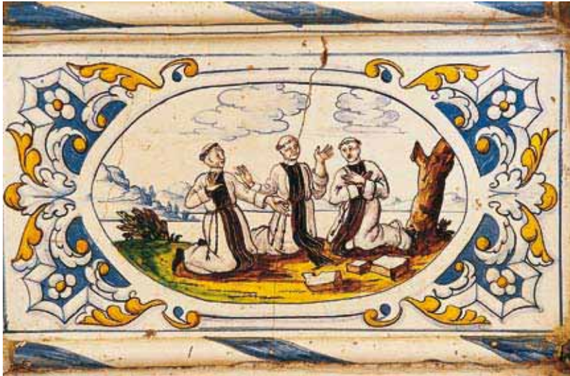
LÆGBRØDRE DER BEDER UNDER ARBEJDET I MARKEN

stadigvæk hårdt. Fordi hun endnu ikke var kommet sig over, hvordan hendes mørke af den himmelske musik var blevet forvandlet til lys.