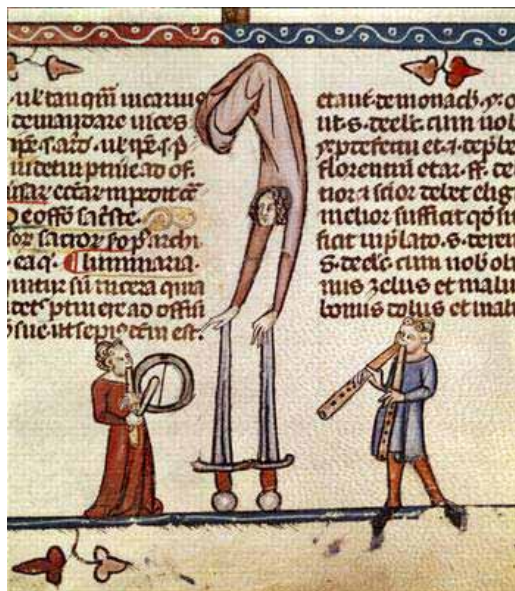
AKROBAT OG MUSIKANTER

“Er du da helt fra sans og samling, kvinde! Hvis det ikke havde været, fordi du havde arvet Varnhem, så ville du stadigvæk sidde i dit kloster og vansmægte. Det var jo på grund af Varnhem, at vi blev gift.”