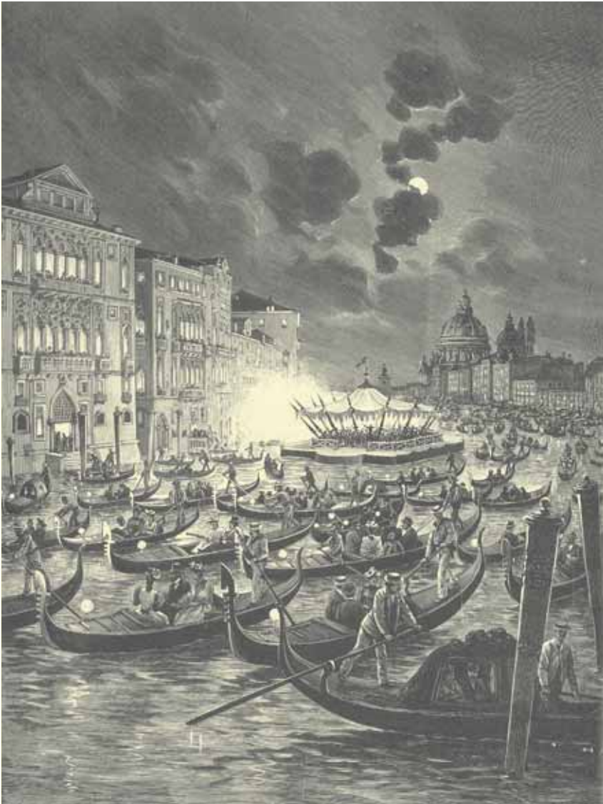
En Aftenfest paa „Canal grande” i Venedig.

lem alperne for at undgå at blive kværnet. Dette er blevet kendt via Gantes ungdommelige ko-medie, en lille lokal radiostation i Brandert-passet. Bortset fra disse knallerter, så sejler italienerne rundt i Venedig med lange stænger i en udhulet gajol, og borgmesteren i byen hedder Sukkenes Bo; men det ser jeg ingen grund til at oplyse om.