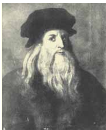
Leonardo da Vincis Selvportræt.

Hist og pist brandmærker italienerne i øvrigt stadig deres kvæg. På denne måde kan de vide, hvems køer der er hvis, hvis de bliver væk. Altså køerne, ikke italienerne. En af de mærkelige koarter fra disse egne kaldes en fræs-ko. Den høvler rundt på en lille knallert mel-