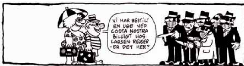
Tegning Jørgen Mogensen.

togsmarch og Kavalleriet i den rustne kane. Det hele begyndte i Milano, hvor toneforkrampede bøvehjerner som Stradiherbarius og nogle kompaner biksede et tonekomplot sammen, der senere har været årsag til grænseløse lidelser.