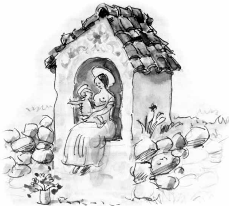
Madonna og barnet i deres usle, lille hus.

Italien har dog også andre ender, idet det har form som en knoldet knæstøvle, der rager ud i Middelhavet til stor gene for den tværgående skibstrafik. På Sicilien ligger for eksempel nedgangen til underverdenen. Den berømte digter Dante skrev sin største kioskbasket her. Her bor også mafiaen, den såkaldte Cosa Moster. Den består af Al Capone og hans kone og alle de andre, som man kender fra dyrefilmen Goatfarther. De lever af blæksprutter, der er så seje, at man kan tygge i en luns fem år uden at nedbryde den i betragtelig grad. Derfor er de da også blevet lidt sære. Altså ikke blæksprutterne, men sicilianerne. De driver et terrorregime ved hjælp af gummilasticum-agtige blækspruttelunser, og det var også på den måde Frank Sinatra kom frem.