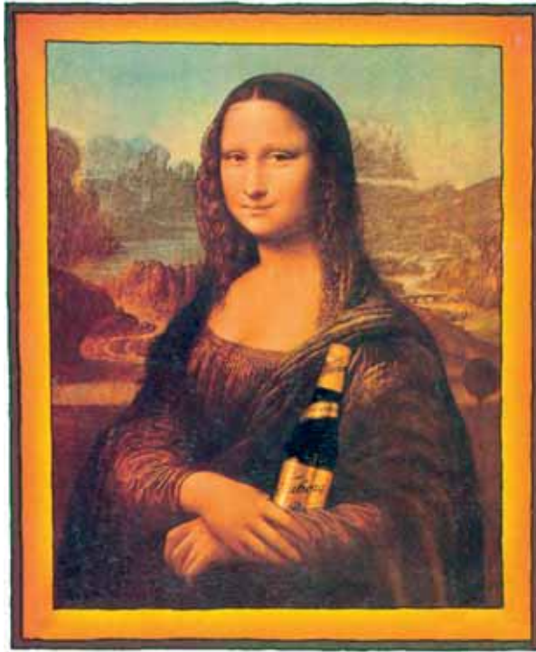
Mona Lisa i originaludgaven. Den danske indflydelse gør sig kraftigt gældende. En ussel kopi hænger i Paris. Tegning Rune T.

Statsform: Støvleagtig. Areal: 301.302 kastratkilometer bestående af olivenlunde og lysninger begroet med italiensk salat. Styreform: Cosa Moster. Befolkning: 57,3 millioner Dario Campeottoer.