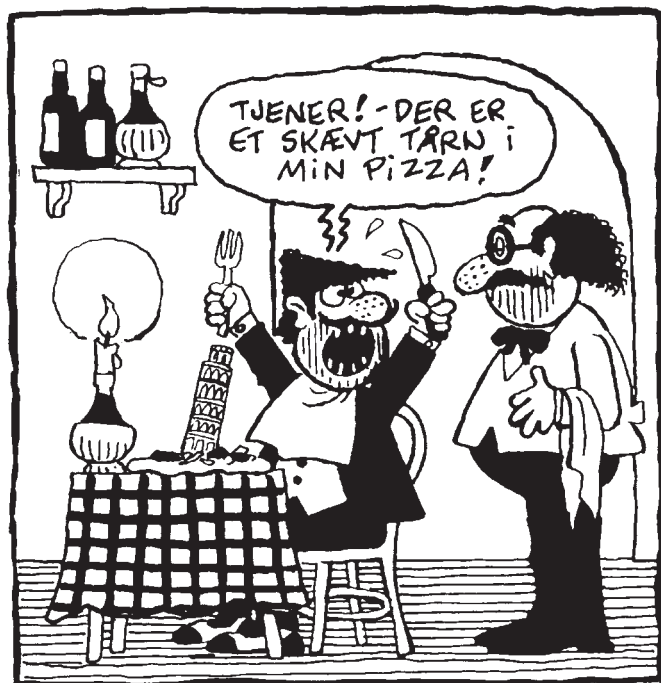
Det skæve tårn i pizza er et typisk tegn på italienernes totale forkludring af alting. Tegning Jørgen Mogensen.

styrret balkon i Verona, hvor en altankasse ved en fejl forelsker sig i en forkalket underskål. Heldigvis er der dog også en verden udenfor.